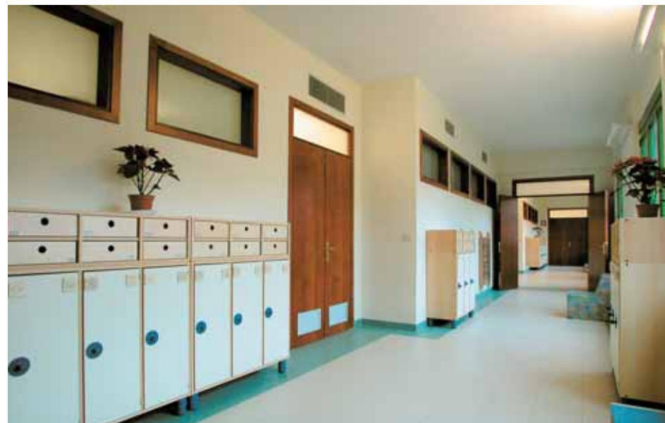
entrando al nido