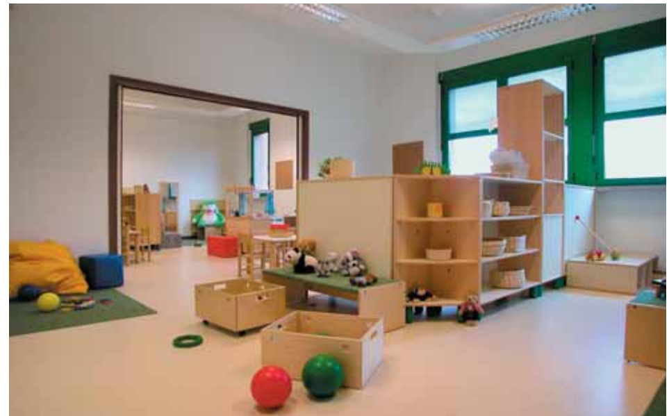
il legno, protagonista, accoglie i colori