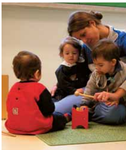
benessere, suono, gruppo