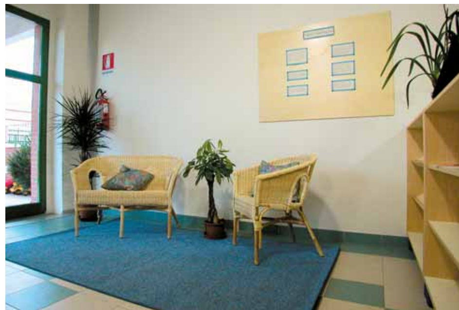
l'accoglienza dei genitori