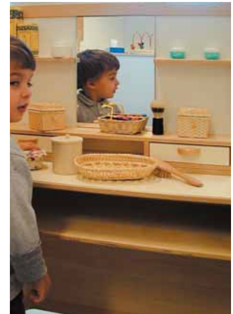
lo spazio travestimenti