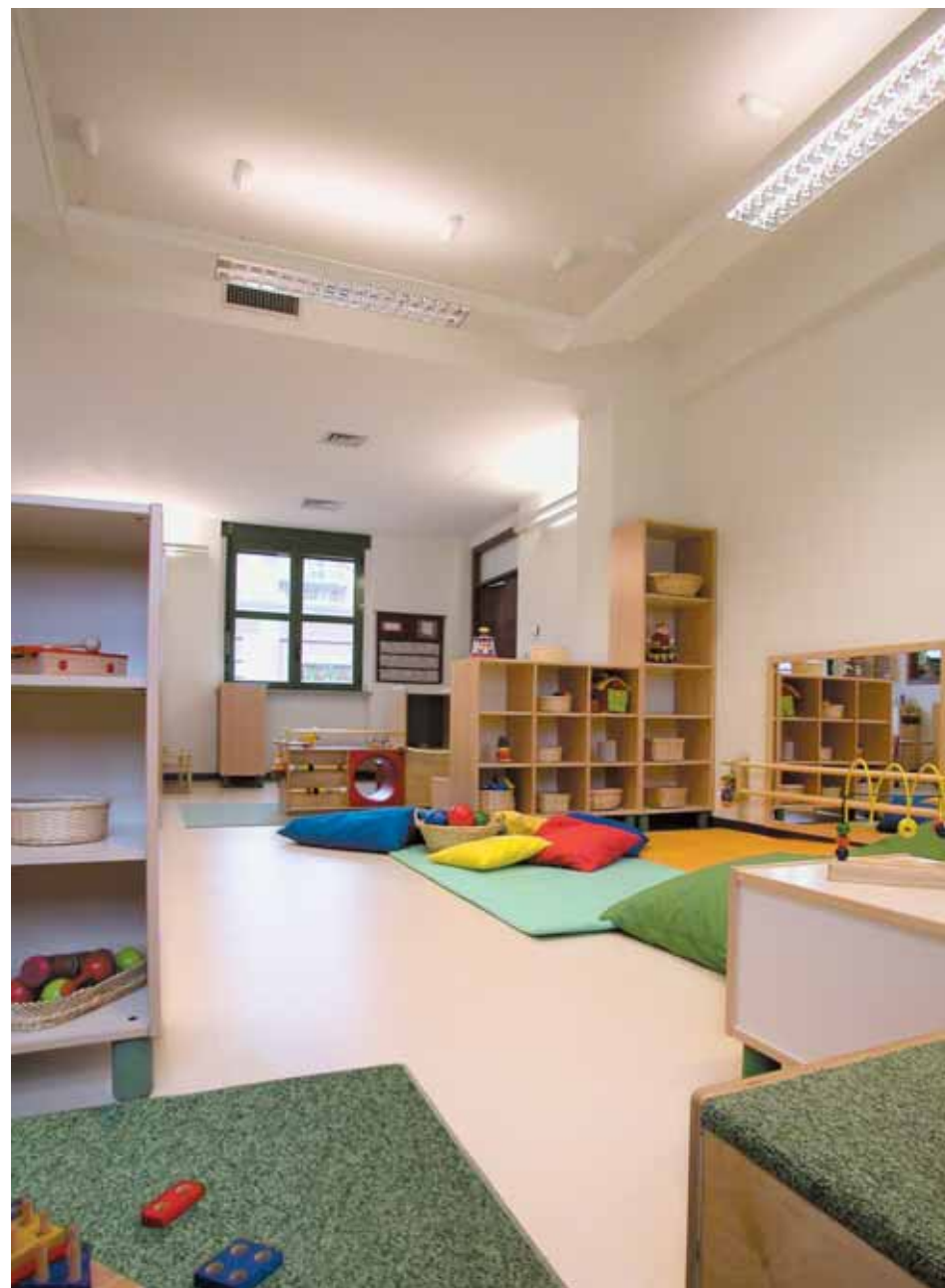
le diverse possibilità di gioco e attività