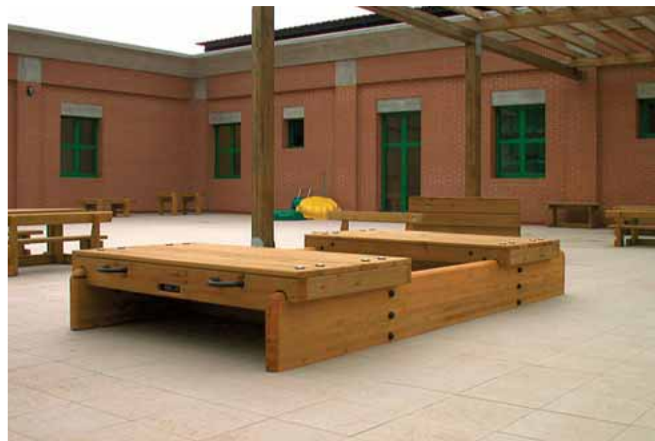
giochi con la sabbia