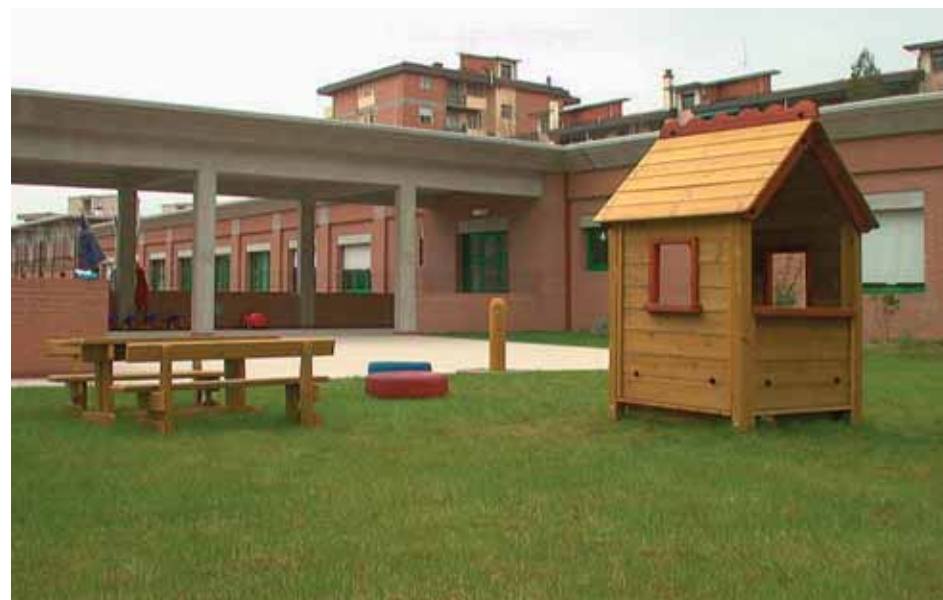
giocando in giardino

Inoltre, lo spazio esterno è un luogo di gioco a cielo aperto , nel quale le dimensioni del gioco, delle relazioni, degli incontri appaiono sotto una prospettiva diversa. Per questo gli spazi esterni sono stati progettati e realizzati con grande cura e con massima attenzione da TLF, con lo scopo di creare un'estensione educativa del nido.