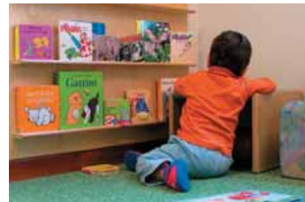
lettura e costruzione