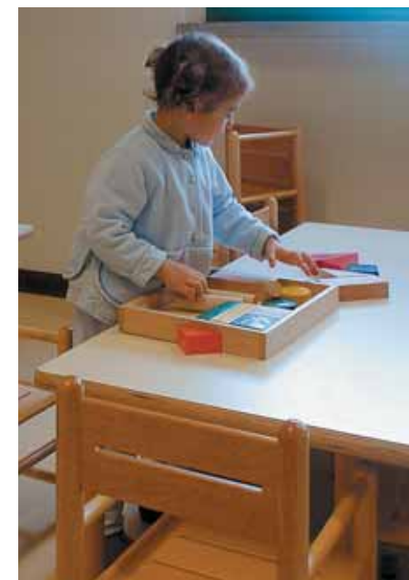
tra logica e sensorialit