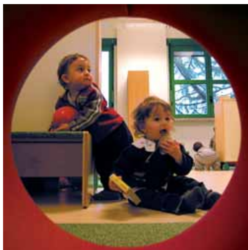
momenti di gioco