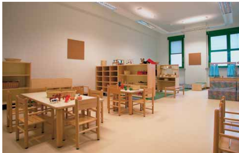
l'armonia cromatica del nido