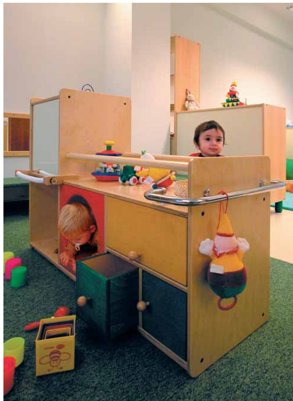
primi passi al nido

• Angolo pranzo. Nel considerare questo spazio si è pensata una proposta diversificata in due zone. Tenendo conto della crescita dei bambini sono stati adottati seggioloni individuali, tavoli pappa, piccoli tavolini con sedie che danno la possibilità di essere variati nel corso dell'anno. Inoltre, al momento del pranzo tutto il personale è presente e quindi l'adulto (educatore e operatore) ha un posto a tavola per ogni sottogruppo di bambini.