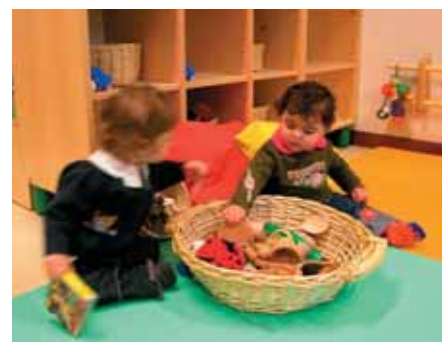
Il cestino dei tesori

• Angolo del movimento con arredi che consentono al bambino di muoversi su livelli diversi e che gli permettono di essere sostenuto per iniziare i primi passi;