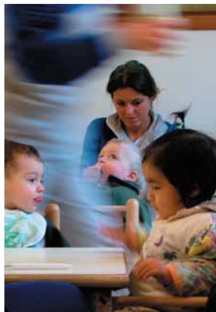
le relazioni al nido