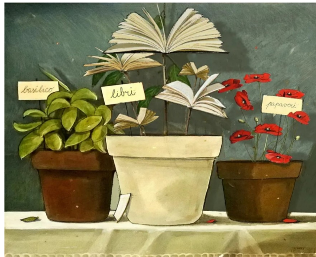
La coltura della cultura.

A chi è rivolto: a tutti/e i/le bambini/e, della scuola dell'infanzia Lavagnini.