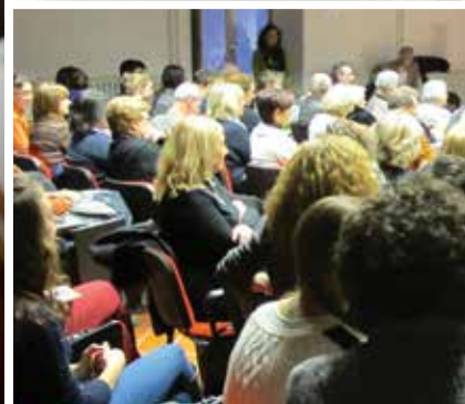
Laboratori di fisica e di lingue