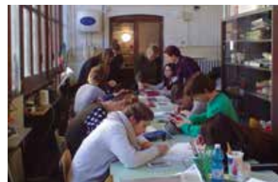
Laboratori di arte e di fotografia

Per valorizzare le eccellenze, il Liceo partecipa ai Certamina nazionali delle lingue classiche, alle Olimpiadi di Matematica, alle Olimpiadi della Lingua Italiana, ai Colloqui Fiorentini e ad altre iniziative culturali di rilevanza nazionale.